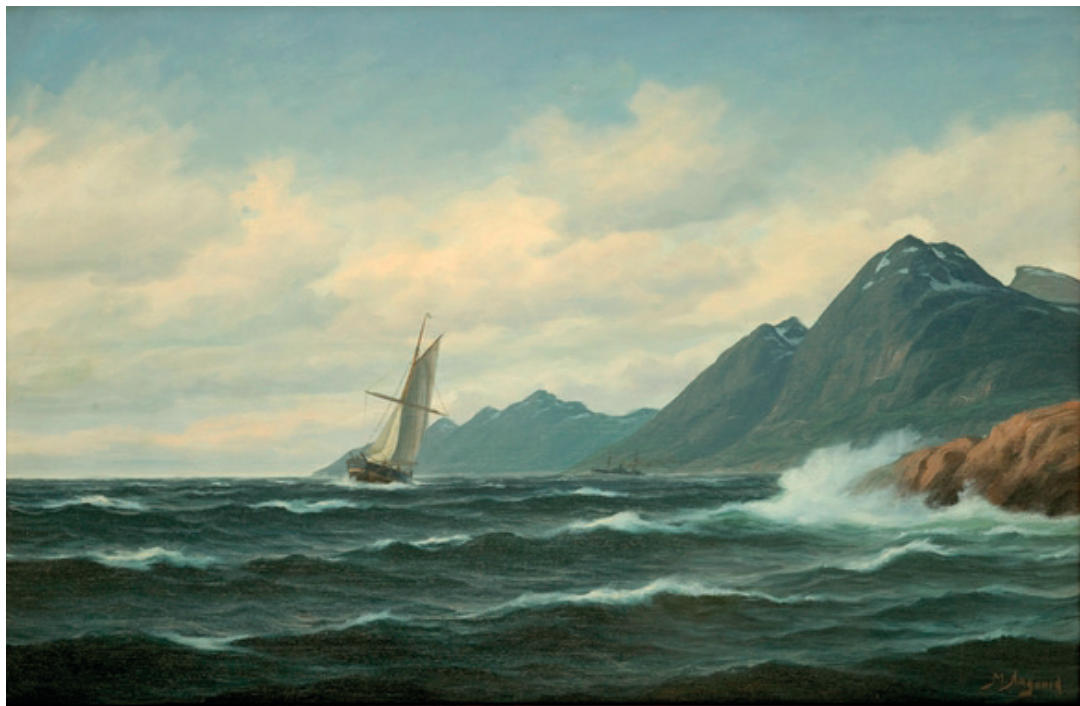
«Kystlandskap» Martin Aagaard (1863–1913)