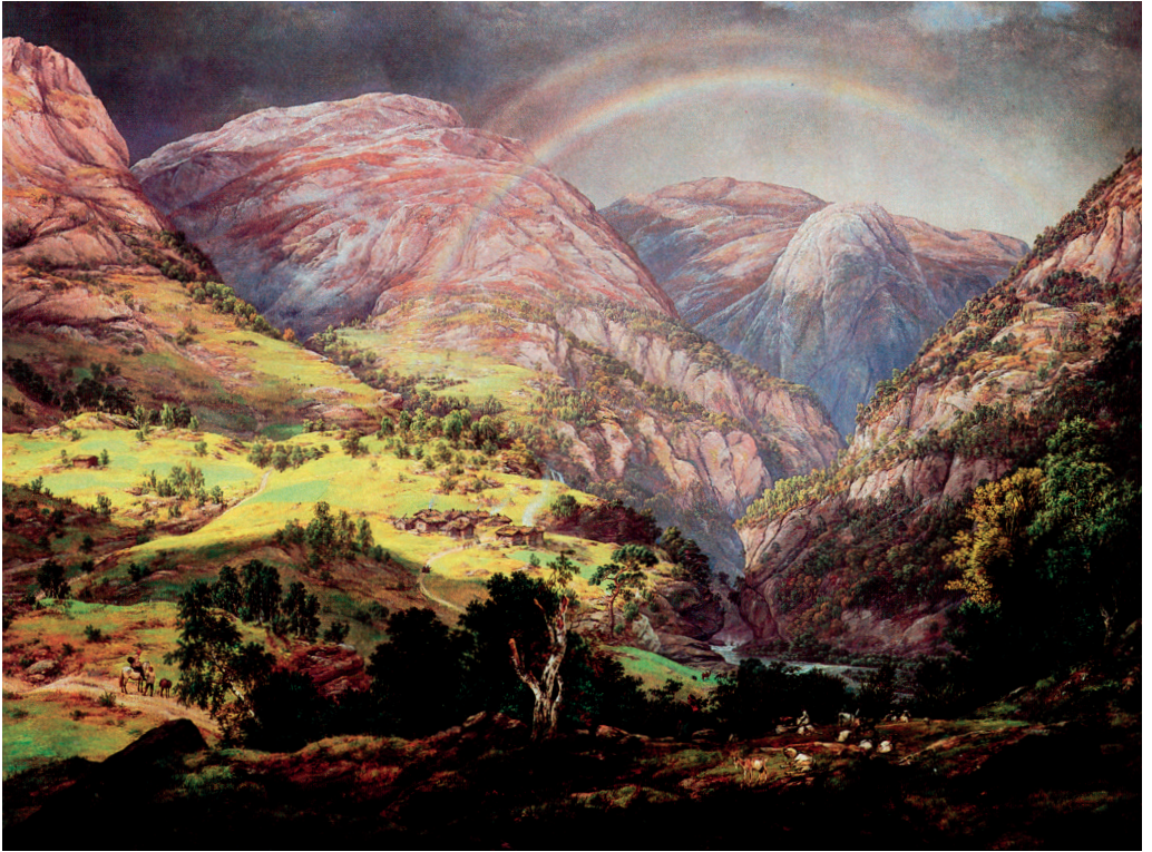
Utsikt fra Stalheim over Nærødalen - J.C. Dahl, 1842