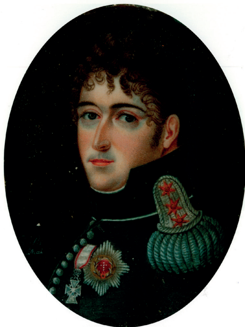
Miniaturportrettet er datert 22. mai 1814 – årsdagen for Christian Frederiks ankomst til Kristiania